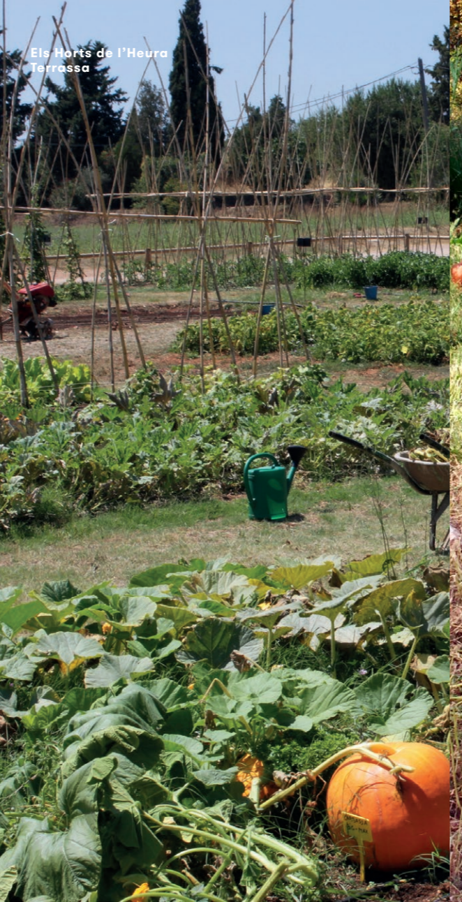
Els Horts de l'Heura Terrassa