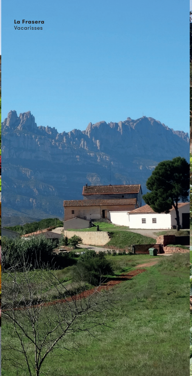
La Frasera Vacarisses