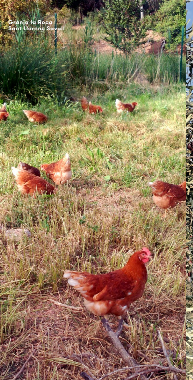
Granja la Roca Sant Llorenç Savall