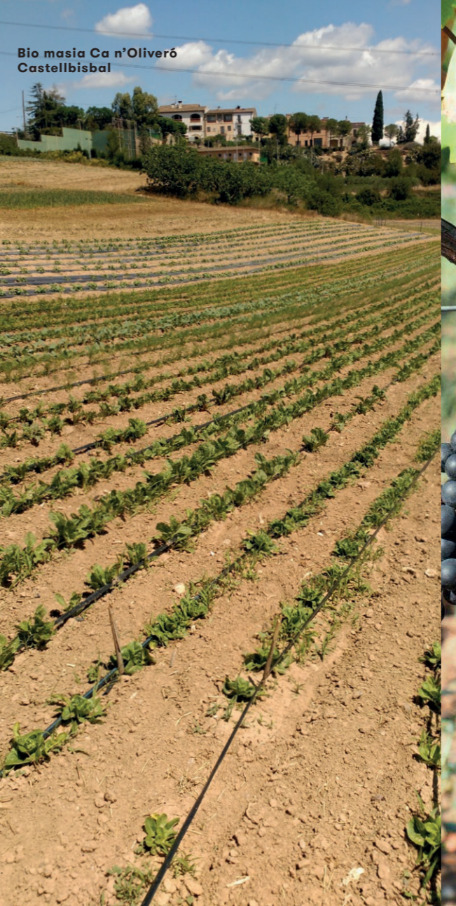
Bio masia Ca n'Oliveró Castellbisbal