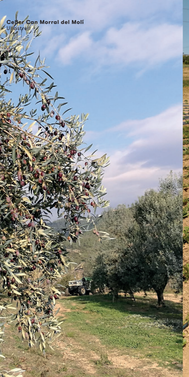
Celler Can Morral del Molí Ullastrell