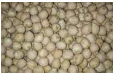
Cigró menut. Fotografia: CCVOC

Menut, gros i negre, del mollar, cigró gran, cigró menut.