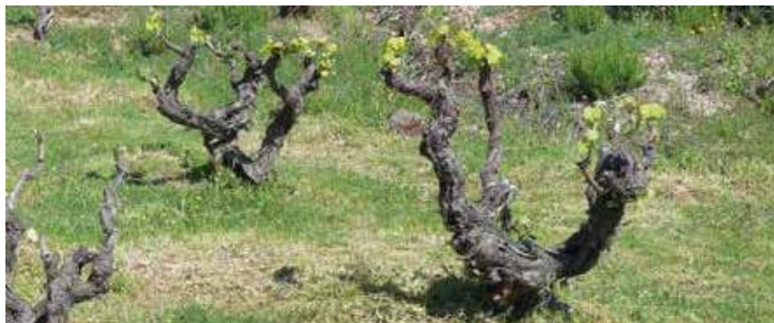
Vinya de l'amfiteatre a Can Morral del Molí, Ullastrell.

Certament, al voltant del sector vitícola es creà un ampli moviment econòmic i també politicosocial (el moviment rabassaire o la Unió de Vinyaters del Vallès). Cal tenir en compte que les xifres de producció de vi a la comarca cap al 1890 arribaven a 384.00 hectolitres i que més del 60 % del territori vallesà estava reple de vinyes 1 . La quantitat de cellers