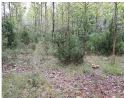
Zona on es cultivava l'arròs a les terres de Mas Fonoll.

Mateu de Sobregrau ens va explicar que en els escrits de l'arxiu familiar, trobà que un dels masovers de la casa anava a ajudar a sembrar l'arròs al Fonoll.