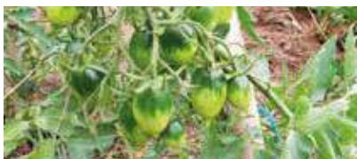
Cultiu de tomàquet Ramellet de Castellar.