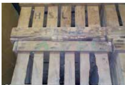
Caixa de tres sostres "bitllot" de Vicenç Moliner.