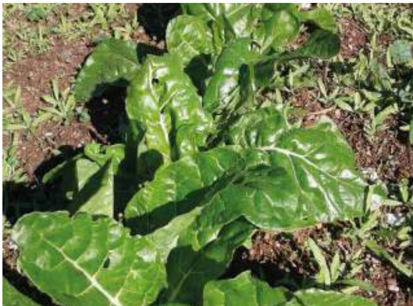
Cultius de l'horta.

El Vallès, gràcies a l'empenta dels seus mercats i també per la demanda del mercat barceloní, va poder diversificar els seus cultius (policultius). A més, cal tenir en compte les condicions climàtiques i geogràfiques de la comarca per entendre les diverses tradicions agrícoles locals.