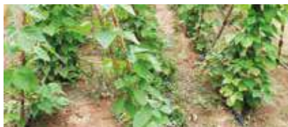
Cultiu de mongeta llaminera o ramellet.