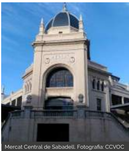
Mercat Central de Sabadell.

Cadascun dels pagesos, majoritàriament eren dones, tenia assignat un número i lloc diferent, que variava cada dia. L'assignava un encarregat, en Pepet, que anava enumerant per ordre de número, el lloc de cada pagès. El