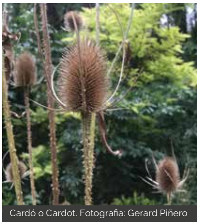
Cardó o Cardot.