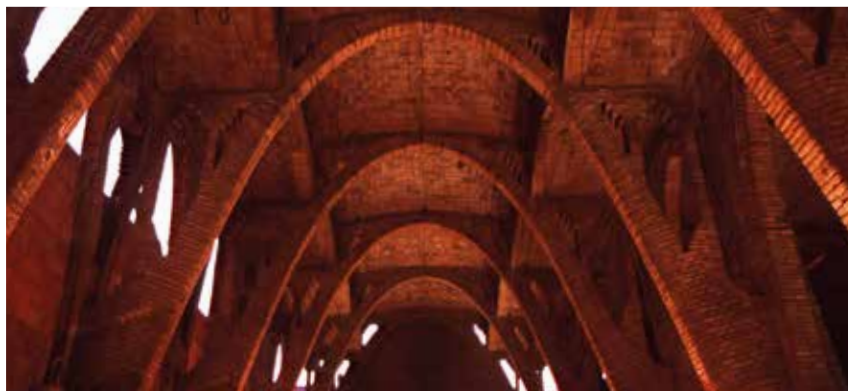
El Celler cooperatiu de Sant Cugat, obra de Cèsar Martinell.

Cal esmentar també les festes del most que se celebraven a tots els pobles després de la verema.