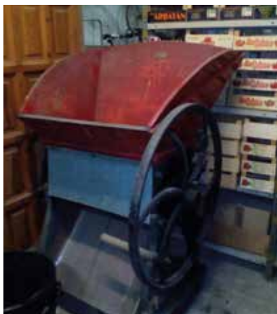
Aixafadora de Vicenç Moliner.

Retornant al sistema del vi bullit a la brisa, voldria afegir que aquest tenia l'avantatge que, com que no bullia el most a les botes, el tartrà quedava a la brisa i, conseqüentment, s'incrustava molt poc a les botes. El tartrà és una substància del most que, en bullir-lo, adquireix la forma d'una crosta cristal·lina rogenca. Si el most bullia a les botes, cada quatre o cinc anys calia anar al boter perquè les desfonés d'una punta i les escurés.