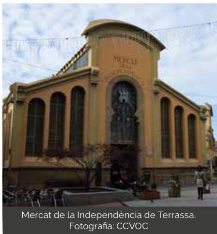
Mercat de la Independència de Terrassa.

"De les parades en dèiem metro. Eren molt petites, només hi cabien tres caixes de llarg. Les parades es dividien entre les de cara i les de cul a la paret. Entremig, en dèiem carrers, hi passava la gent. Venien pagesos d'Ustrell (Ullastrell), Castellbisbal, Mata-depera, etc. Les parades, ja en aquella època, es compraven. Es pagava un tant anualment".