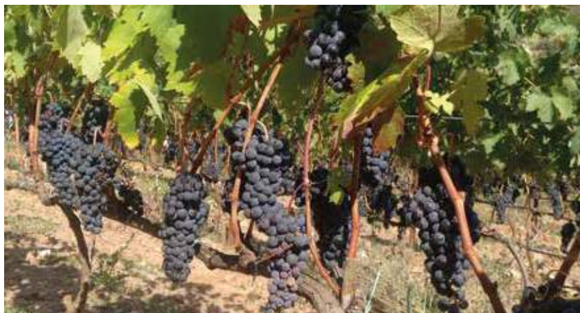
Raïm de la varietat ull de llebre a les vinyes de La Muntada, Vall d'Horta (Sant Llorenç Savall).

Hi havia una gran varietat de raïm, destinat tant a fer vi com a raïm de taula. Grau i Garriga fa un breu resum de quines varietats es comercialitzaven a Sant Cugat: "[...] el que predominava més era el pansalet (xarel•lo). Era molt bo, fins i tot a taula" 6 .