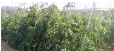
Cultiu tomàquet Mandó a Can Coll (Cerdanyola).