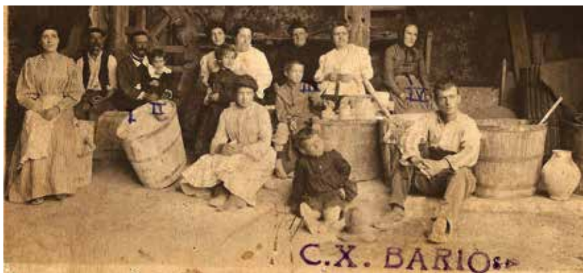
Trull d'oli de Can Xercavins. Arxiu fotogràfic de Can Xercavins. Autoria desconeguda, ca. 1900

Tan important va ser el cultiu de l'olivera, que al Vallès es crearen nombrosos trulls, alguns de caràcter particular –per al seu autoconsum- i d'altres, adreçats al servei dels pagesos del voltant.