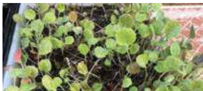
Cultiu de la col gegant.