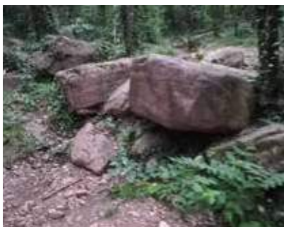
Resclosa del torrent de la Roca.