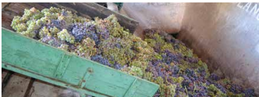
Fotografia de la verema a Ullastrell.

Són moltes les fites aconseguides pels antics vinyataires vallesans, en la seva recerca d'una certa especialització en aquell món del vi tan estès arreu de Catalunya. Més enllà dels números estrictament productius, es pot dir que al Vallès hi va haver una corrent força àmplia que cercava fer-se un forat en el mercat vinícola peninsular i també internacional.