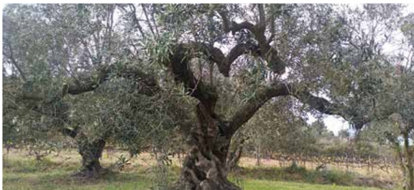
Olivera becaruda a Can Morral del Molí, Ullastrell.

Tan important va ser el cultiu de l'olivera, que al Vallès es crearen nombrosos trulls, alguns de caràcter particular –per al seu autoconsum- i d'altres, adreçats al servei dels pagesos del voltant.