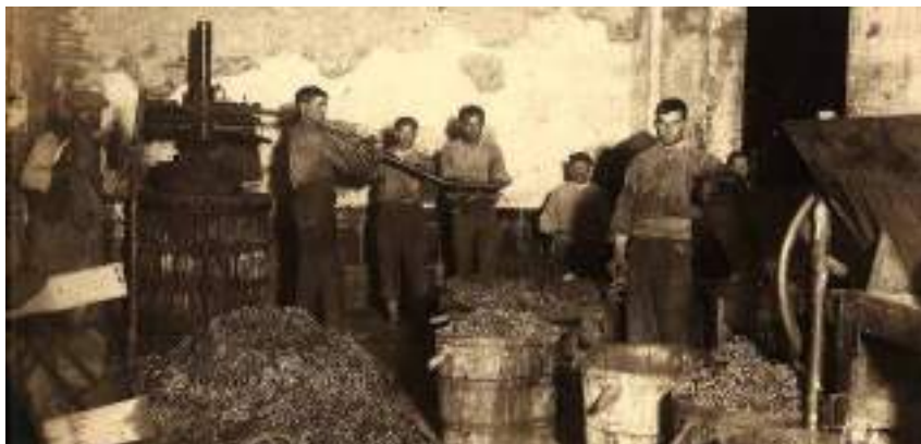
Premsat de raïm a la casa de Can Xercavins 1918.