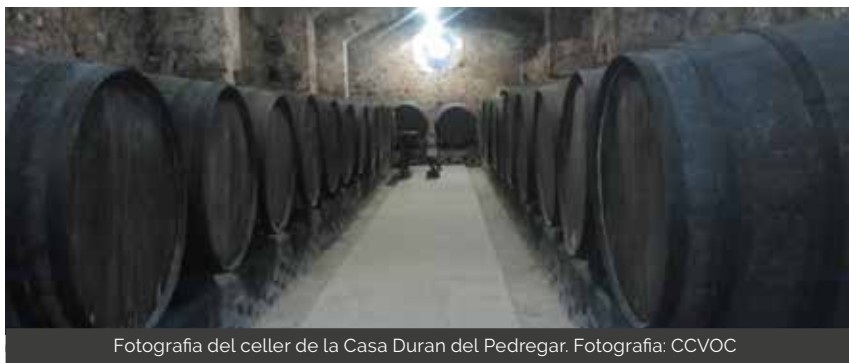
Fotografia del celler de la Casa Duran del Pedregar.

Les botes calia estanyar-les- és a dir, humitejar-les fins a reinflar la fusta interior de la bota- constrènyer-les bé per impedir qualsevol tipus de fuita que permetés entrar l'aire i oxidar el vi que hi hagués dins. S'hi posava el lluquet (sofre que es cremava) per comprovar si la bota havia acollit en bones o males condicions el vi del darrer any. Si el lluquet s'apagava volia dir que hi havia problemes en aquella bota. En aquest cas, s'havia de fer "l'estuba", un macerat d'aigua calenta, sal i herbes del bosc (també s'empraven fulles de figuera), que eliminava l'olor del vi defectuós.