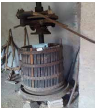
Darrera prensadora que es va utilitzar a Can Xercavins 49 .

estava composta per dos corrons que feien la funció d'aixafar el raïm amb més precisió. També, la casa de Can Xercavins de Rubí conserva la darrera prensadora que varen usar.