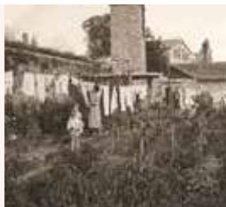
Els hortets de la casa de Can Xercavins, on es poden observar les tiges altes de la col gegant. Arxiu fotogràfic de Can Xercavins. Fotografia: Pere Xercavins, 1955.

Col de gran tija que es desfulla. Es feia servir per donar de menjar al bestiar. Segons en Xavier Morral, de Can Morral del Molí d'Ullastrell, "els brotons que en surten de la geganta són molt dolços" . És una varietat de col que gairebé tothom cultivava al Vallès. A més, s'aprofitava el fet que tenia la tija gran per sembrar-hi maduixeres a l'entremig. Pep Salsetes n'està recuperant la varietat per al consum humà.