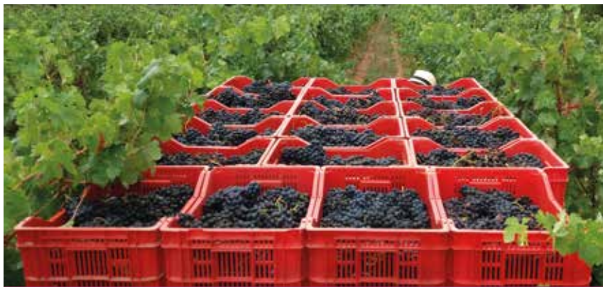
La verema a les vinyes de la masia La Muntada, a la Vall d'Horta.

La temporalitat variava segons la zona i les varietats de ceps que tenia cada casa però en general es veremava entre mitjans de setembre i inicis d'octubre. Això si el temps no ho impedia o les pedregades no deixaven les collites anorreades. Un document de l'arxiu històric de Can Xercavins de Rubí cita l'any 1873 una gran pedregada, vinguda de Tarragona i que finí a Mataró. Aquell any no es collí cap gotim.