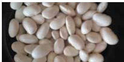
Mongeta del carai o del carall.

Altres varietats citades durant les entrevistes: mongeta avellaneta, mongeta del veremar, mongeta del cuc, mongeta perona, mongeta ull de perdiu, mongeta del ganxet terrer, mongeta de la neu, mongeta del carai o carall, mongeta caragi-rada, mongeta catalaneta.