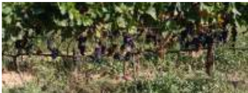
Vinyes de raïm samsó a La Muntada, Vall d'Horta (Sant Llorenç Savall).

A continuació, trobareu algunes de les tasques que es realitzaven a la vinya per part de vinyataires del Vallès i també explicarem com elaboraven el vi i els costums derivats de "menar la vinya" i de "fer el vi" a la nostra comarca 36 .